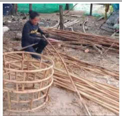
សកម្មភាពសមាជិកក្រុមកែច្នៃផ្តៅ/ឫស្សីនៃសហគមន៍ តំបន់ការពារភ្នំទ័ពជាងតំលើងផងទឹកធ្លោះពីផ្តៅ/ឫស្សី

គោលបំណងនៃគម្រោងគឺ "អង្គការសហគមន៍ចំនួន៥ ជុំវិញឆ្នេរសមុទ្រកំពង់ សោមគ្រប់គ្រងព្រៃឈើប្រកបដោយនិរន្តរភាព និងកាត់បន្ថយសម្ពាធរបស់ មនុស្សលើធនធានធម្មជាតិ តាមរយៈគំនិតផ្តួចផ្តើមមុខរបរចិញ្ចឹមជីវិតដែល បន្ស៊ាំនឹងអាកាសធាតុប្រែប្រួល។"