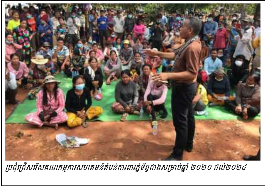
ប្រជុំព្រឹទ្ធសវីសគណកម្មការសហគមន៍តំបន់ការពារភ្នំទ័ពជាសម្រាប់ឆ្នាំ ២០២០ ដល់២០២៤

ក៏ធ្វើការជាមួយអង្គការតាមសហគមន៍ ចំនួន១៩ដែលធ្វើការលើការគ្រប់គ្រង ធនធានធម្មជាតិដែលគ្របដណ្តប់លើ ផ្ទៃដី៥៨,១២២ហិកតារួមមាន៖ សហគមន៍ នេសាទចំនួន៨ សហគមន៍ព្រៃឈើចំនួន ៣និងសហគមន៍តំបន់ការពារចំនួន៨។ ក្រុមទាំងនេះដំណើរការស្របតាមតម្រូវ ការរៀងៗខ្លួនរបស់រដ្ឋបាលធនធាន រដ្ឋបាលព្រៃឈើ និងក្រសួងបរិស្ថាន។ ក្រុមសហគមន៍ទាំងនោះរួមមានមេដឹកនាំ ជាប់ឆ្នោតប្រហែល១៨០នាក់ (ក្នុងនោះ ប្រហែល២០%ជាស្ត្រី) និងមានសមាជិក