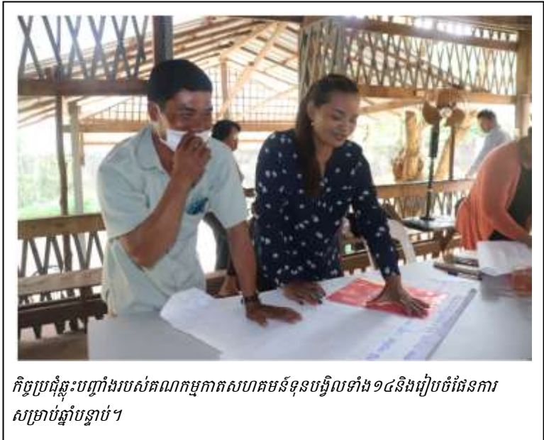
កិច្ចប្រជុំបញ្ជាក់របស់គណៈកម្មាធិការសហគមន៍ទូទៅទាំង១៤និងរៀបចំផែនការសម្រាប់ឆ្នាំបន្ទាប់។

គម្រោង "ពង្រឹងជីវភាពសហគមន៍ និងការគ្រប់គ្រងធនធានធម្មជាតិនៅជុំវិញឆ្នេរសមុទ្រកំពង់សោម" គ្របដណ្តប់លើការងារអង្គការមរតកក្នុងដំណាក់កាលកម្មវិធីបច្ចុប្បន្ន។ គម្រោងនេះបានទទួលមូលនិធិពីអង្គការ "Bread for the World" ដែលមានមូលដ្ឋាននៅប្រទេសអាឡឺម៉ង់ រួមគ្នាជាមួយនឹងអ្នកផ្តល់មូលនិធិផ្សេងទៀតដែលគ្របដណ្តប់លើការចំណាយនៃគម្រោងតូចៗនៅក្នុងគម្រោងធំជាងនេះ។