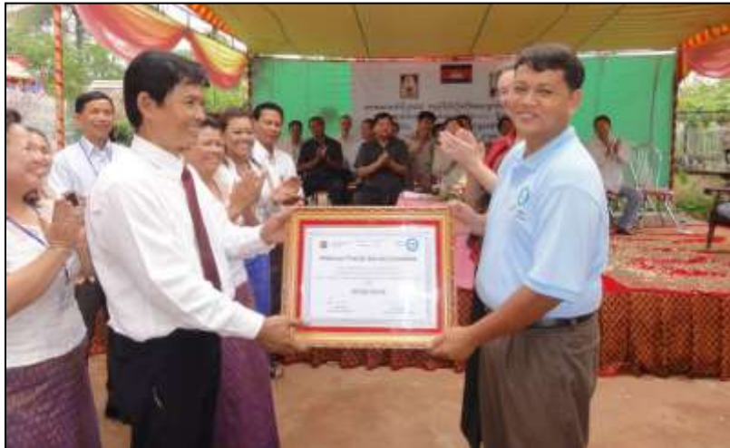
នៅខែតុលា ឆ្នាំ២០១១ AFSC បានប្រគល់គម្រោងISLP ជាផ្លូវការដល់បុគ្គលិកខ្មែរ ដែលបានបង្កើតអង្គការ “ មេតក ” ។

នៅថ្ងៃទី០១ខែតុលា ឆ្នាំ២០១១ អង្គការAFSCបានប្រគល់កម្មវិធី“ISLP”ទៅអង្គការ “ មេតក ”។ ពិធីប្រគល់ត្រូវបានប្រារព្ធឡើងនៅស្រែអំបិល នៅថ្ងៃទី០៥ខែតុលា ឆ្នាំ២០១១។ ចាប់តាំងពីពេលនោះមក “ មេតក ” បានបន្តធ្វើការក្នុងតំបន់ ដោយលើកទឹកចិត្តក្រុមសហគមន៍ឱ្យទទួលយកសិទ្ធិរបស់ពួកគេលើការប្រើប្រាស់ធនធានធម្មជាតិនិងការកែលម្អជីវភាពរស់នៅ។ បុគ្គលិក “ មេតក ” ធ្វើការជិតស្និទ្ធជាមួយអ្នកដឹកនាំសហគមន៍ ដោយជួយពួកគេក្នុងការលើកកម្ពស់ភាពជាម្ចាស់ក្នុងការអភិវឌ្ឍន៍សហគ្រាសសង្គម និងការគ្រប់គ្រងធនធានធម្មជាតិប្រកបដោយនិរន្តរភាព។ អង្គការ “ មេតក ”បន្តប្រមូលផ្តុំក្រុមសហគមន៍ឱ្យធ្វើការជាមួយមន្ត្រីរដ្ឋាភិបាលមូលដ្ឋាន និងមន្ត្រីបច្ចេកទេស ដើម្បីជួយក្រុមសហគមន៍រៀបចំពាក្យសុំ និងសំណើរដាក់ជូនស្ថាប័នរដ្ឋថ្នាក់ខេត្ត/ជាតិ សុំសិទ្ធិលើការគ្រប់គ្រងធនធានសហគមន៍នៅតំបន់ឆ្នេរ កំពង់សោម នៃប្រទេសកម្ពុជា។